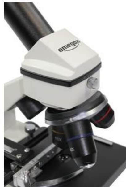
Der Okularrevolver mit Objektiven