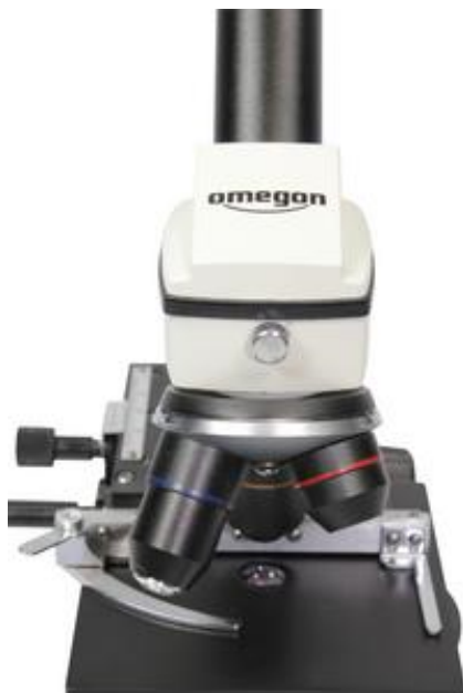
Der Objektisch und Kreuztisch.